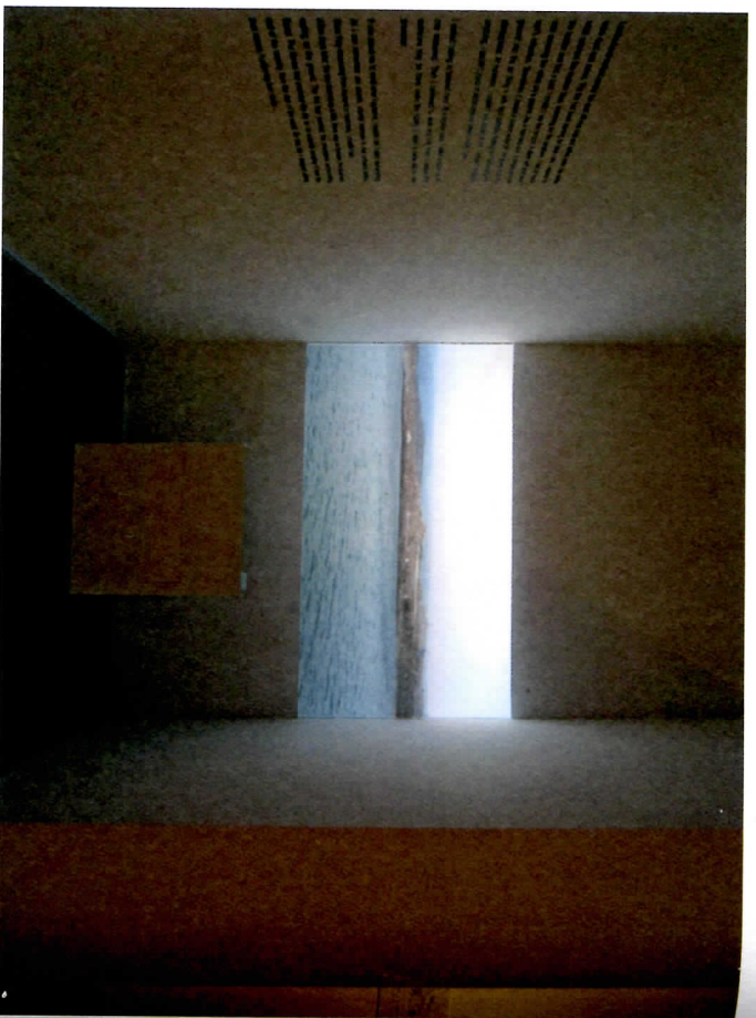
Beyrouth, autopsie d'une ville , chapitre III : « Beyrouth 2058 », Mori Art Museum, Tokyo, 2012.

lâissées dans la ville par les divers événements historiques. Appelé à suivre son déroulement, le spectateur se trouve aussitôt introduit dans un schéma narratif qui s'instaure dès la première partie. À cet effet, l'organisation temporelle choisie pour les différents chapitres joue sans doute un rôle central. Joreige la construit sur deux niveaux : d'une part, à travers le système de datation qui encadre à la fois les textes et les images, de l'autre, par le choix des différents médias utilisés (images d'archives, vidéos, projections) dont l'épaisseur visuelle n'est pas sans faire référence aux différentes époques. Le tout esquissant une parabole temporelle qui oriente le spectateur tout le long du parcours : du passé lointain de la ville vers un futur imaginaire et apocalypique, et ce à partir du présent, lieu temporel où le parcours se construit. Déjà annoncées en exergue 7 , les craintes de l'artiste face