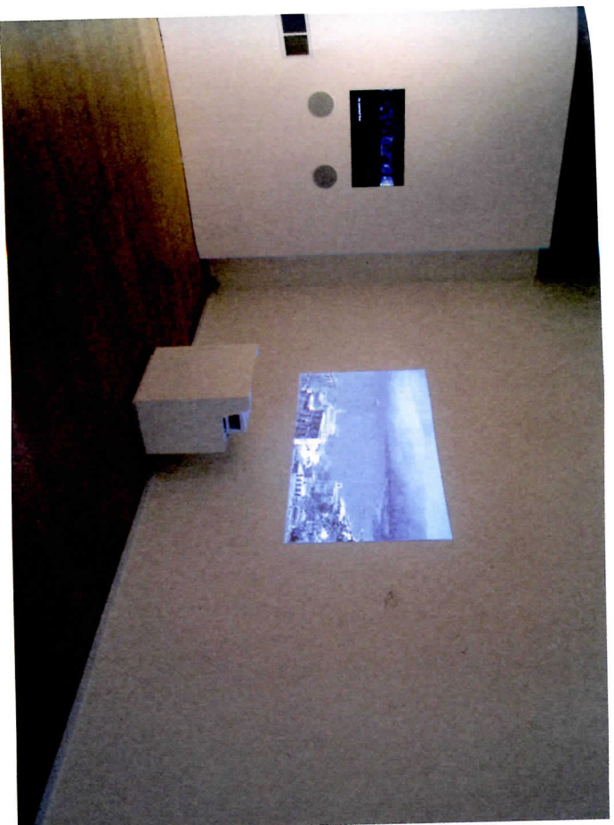
Beyrouth, autopsie d'une ville, chapitre II : « Beyrouth 1 001 vues », Mori Art Museum, Tokyo, 2012.